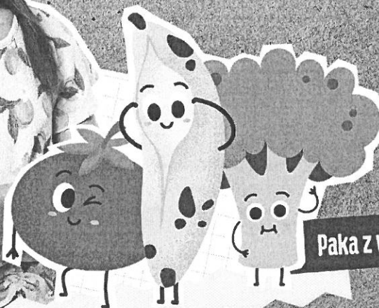
Paka z warzywniaka