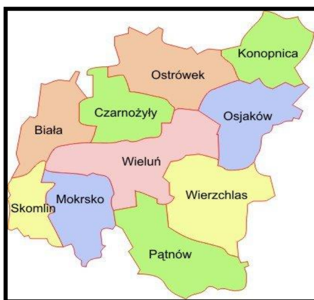
Rys. Powiat Wieluński

Gmina Skomlin jest jedną z 10 gmin powiatu wieluńskiego i jedną ze 133 gmin wiejskich województwa łódzkiego. Leży w południowo-zachodniej części powiatu wieluńskiego. Powierzchnia Gminy Skomlin liczy 55,2 km 2 , liczba ludności na koniec 2018r. wynosiła 3285. Gmina Skomlin jest najmniejszą gminą w powiecie wieluńskim zarówno pod względem wielkości powierzchni jak i liczby mieszkańców.