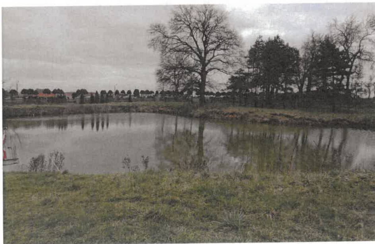
2.2. Zdjęcie stawu gminnego.