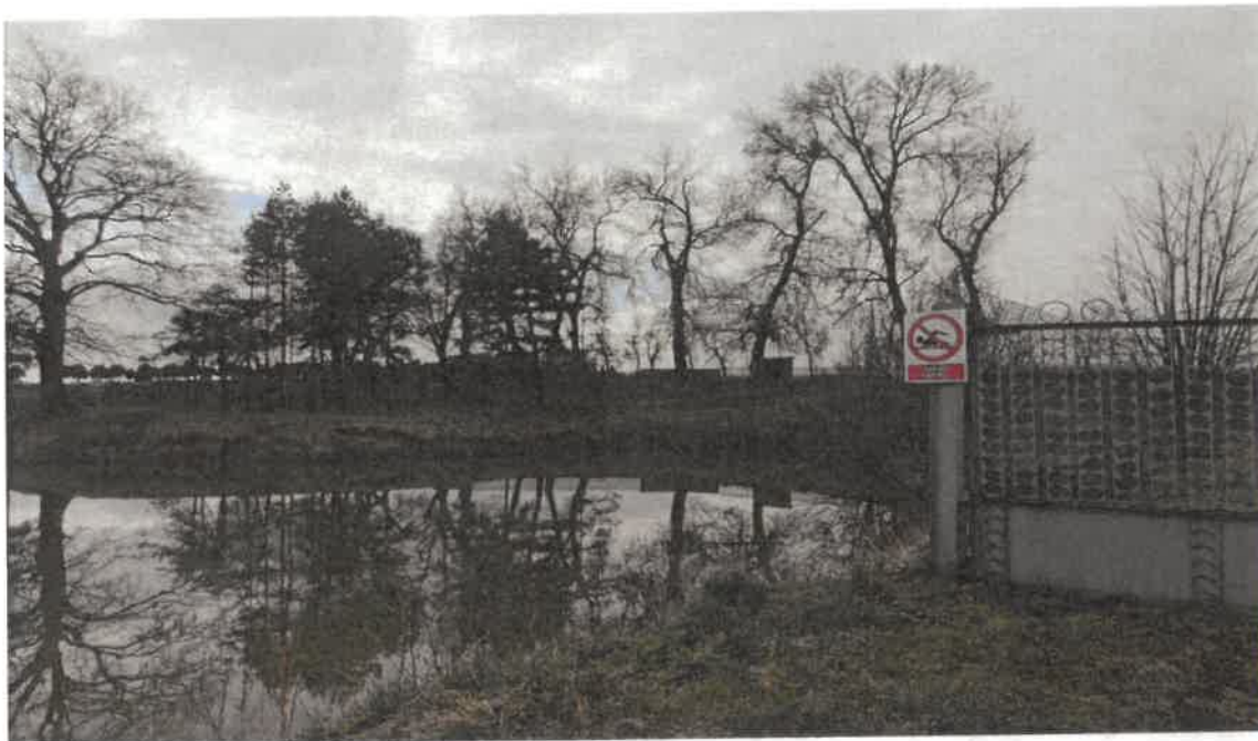
2.1. Zdjęcie stawu gminnego z umieszczonym oznakowaniem A-1 „Zakaz kąpiel”

2) staw gminny w miejscowości Skomlin - staw znajduje się na terenie działki należącej do Gminy Skomlin. Teren jest ogrodzony i oznakowany tabliczką „Zakaz kąpiel”. Akwen wodny oznakowany i niestrzeżony.