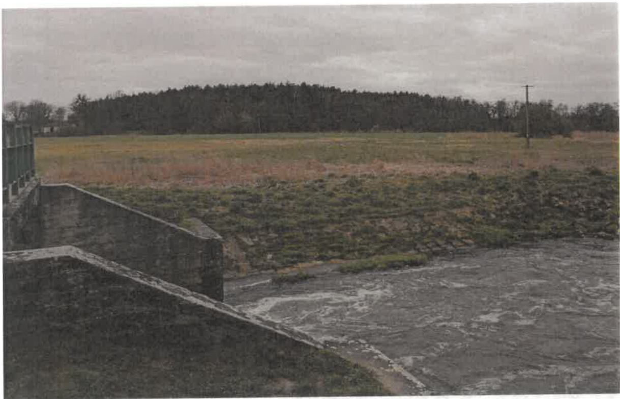
1.3. Zdjęcie rzeki z łagodnym zejściem do wody.