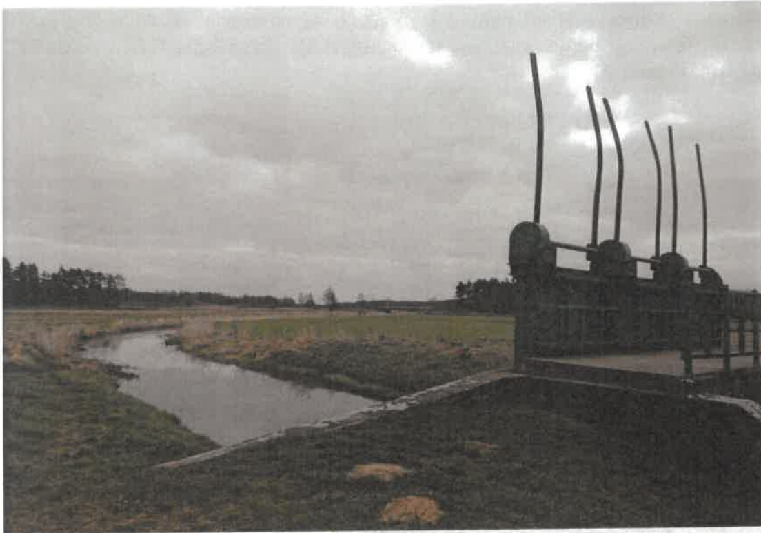
1.2. Zdjęcie rzeki Prosny z tamą.