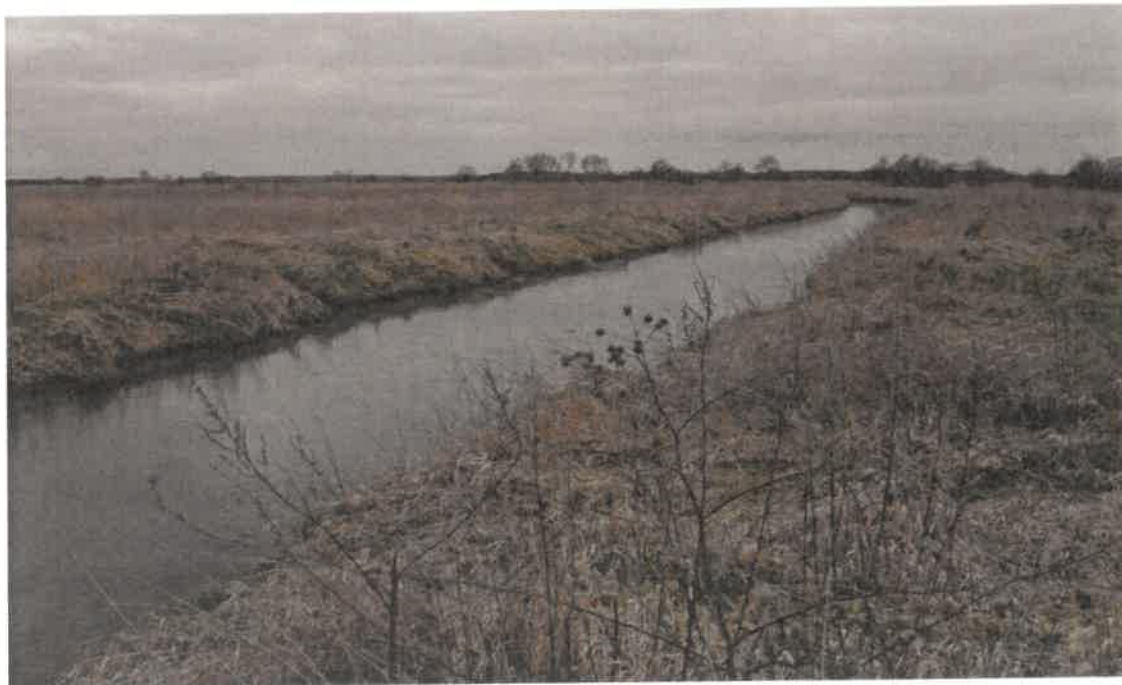
1.1. Zdjęcie rzeki Prozny w miejscowości Ług.

Prosna jest nizinnym szlakiem kajakowym, dostępnym od Wieruszowa do Pызdr na odcinku 150 km. Przebiega głównie w otoczeniu pól i łąk w większości w szpalerach wierzbowych. Prosna, poza „wielką wodą”, nigdy nie wygląda groźnie i nie budzi obaw, dlatego też dla wielu osób rzeka posiada nieodparty urok, będąc wymarzoną miejscem wypoczynku i uprawiania różnorodnych sportów, wędkowania i spacerami nad jej nurtem. Przepływa na terenie gminy Skomlin przez miejscowości Wróblew, Grześlaki, Ług. Na rzece znajdują się dwa mosty oraz tama, które można potraktować jako miejsca okazjonalnie wykorzystywane do kąpieli (dzikie kąpieliska). Do rzeki przylegają działki będące własnością prywatną. Akwen wodny nieoznakowany (ustawiony znak „zakaz kąpieli” został usunięty przez nieznane osoby) i niestrzeżony.